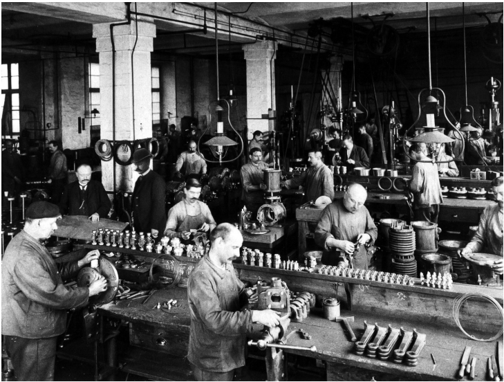
PR-Aufnahmen des Bremsenwerks Knorr zur Akkordarbeit im Betrieb