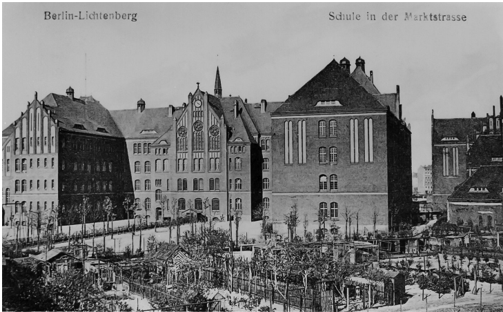
Grete Steffins Volksschule in der Marktstraße am Ostkreuz in einer Aufnahme nach dem 2. Weltkrieg. Heute ist sie eine Jugendherberge, die für sich mit dem Slogan wirbt, »die größte Jugendherberge Europas« zu sein