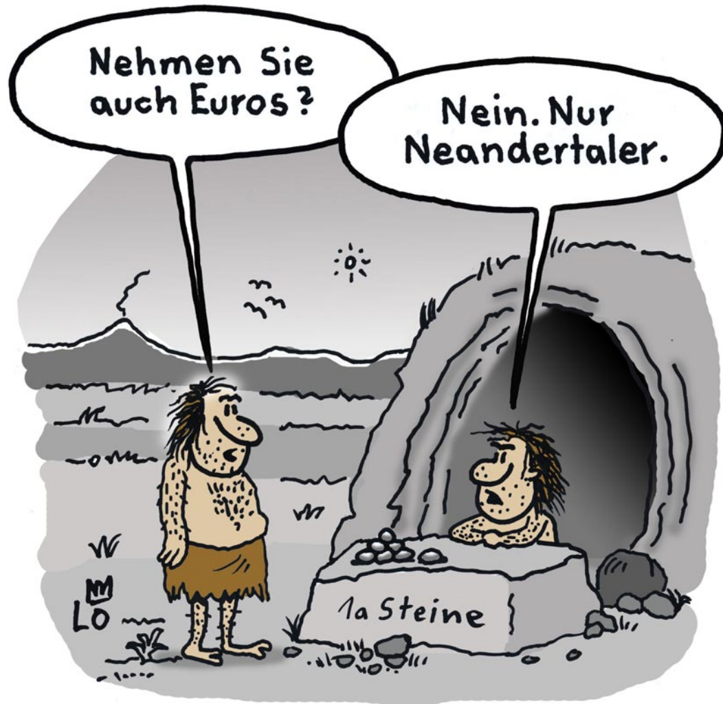
Neulich in der Steinzeit